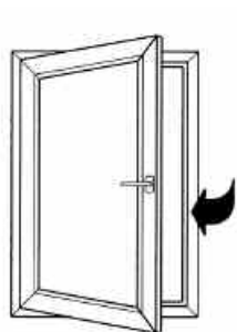
Maçaneta horizontal, janela com abertura tradicional.