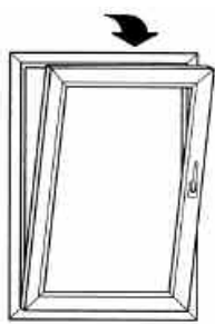
Maçaneta para cima, janela "Maximo Ar"